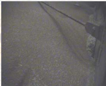
Vidange en cours Reclaiming underway

CLIENT Tate & Lyle – Amylum -France ACTIVITÉ amidonnerie PRODUIT STOCKÉ blé PROJET 4 cellules 14 x 14 m en silo existant MISE EN SERVICE avril 2005 OBJECTIF Remplacement d'un système de ventilation-vidange inopérant CARACTÉRISTIQUES Usine classée "Seveso II" Tau de rotation des cellules hebdomadaire - Pente 7° 18 modules par cellule prémontés en usine Puissance installée 5,8 kW par silo Mis en route/arrêt automatique par 5 détecteurs capacitifs