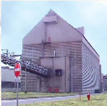
Vue extérieure Outside view