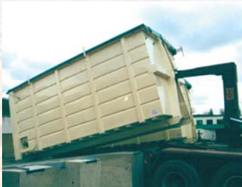
Manutention de benne Container handling