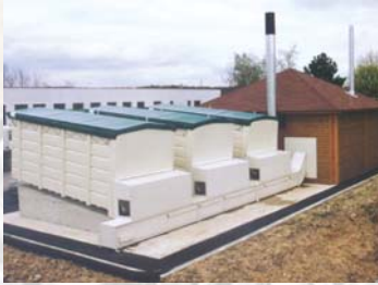
Vue d'ensemble Overall view