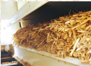
Alimentation du convoyeur Feeding of conveyor