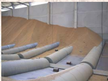
Vues intérieures Inside views

Le silo empli de riz paddy a été inondé durant plusieurs mois au cours de l'hiver 2003/2004.